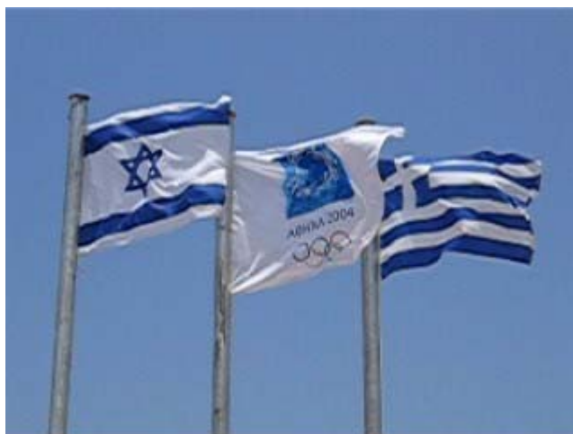
Οι σημαίες της Ελλάδας, του Ισραήλ και της Ολυμπιάδας κυματίζουν στο πάρκο «Αθήνα 2004».