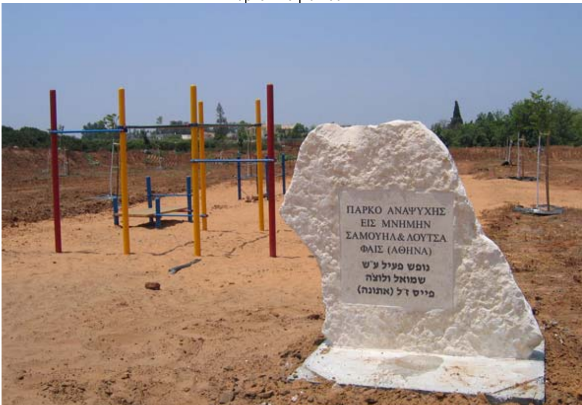
Το Πάρκο Αναψυχής δωρεά της οικ. Φάις από την Αθήνα στο Τσουρ Μωσσέ.