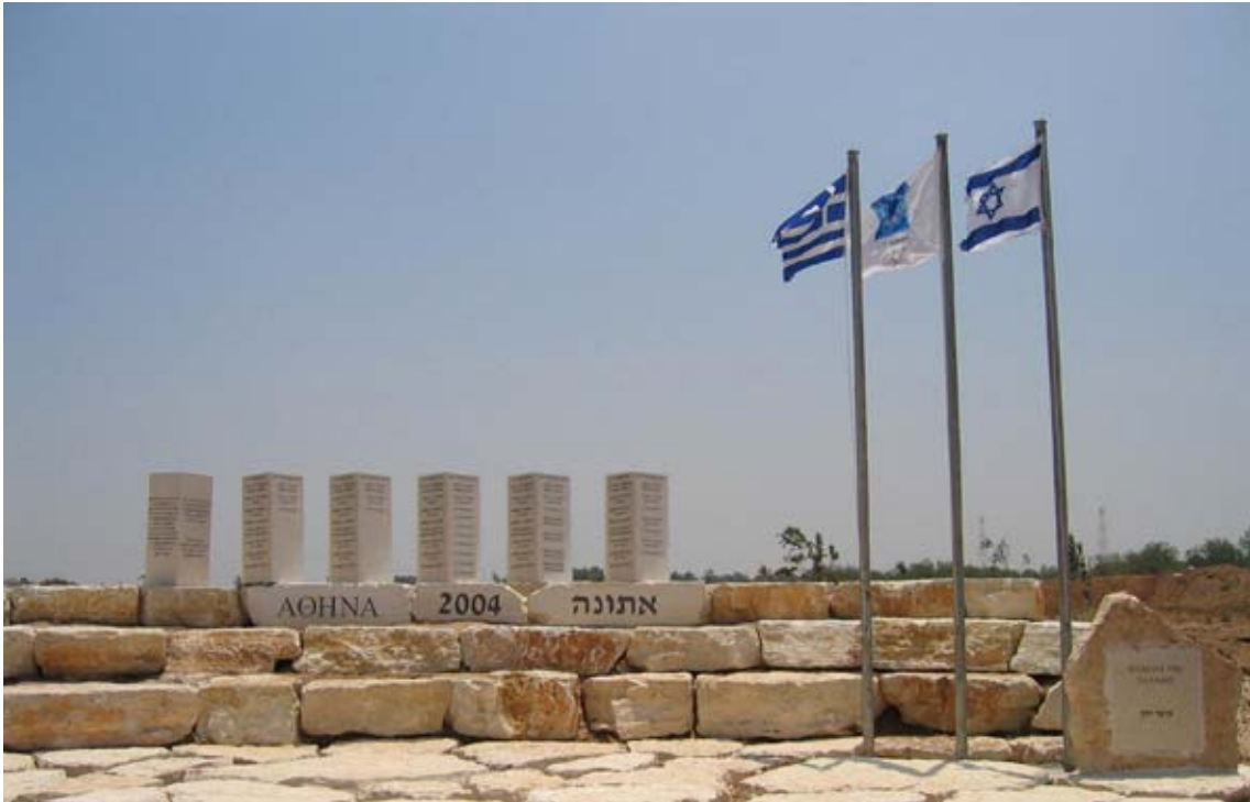
Οι στήλες των δωρητών και οι σημαίες της Ελλάδας, του Ισραήλ και των Ολυμπιακών Αγώνων στο πάρκο «Αθήνα 2004» στο Τσουρ Μωσσέ στο Ισραήλ.